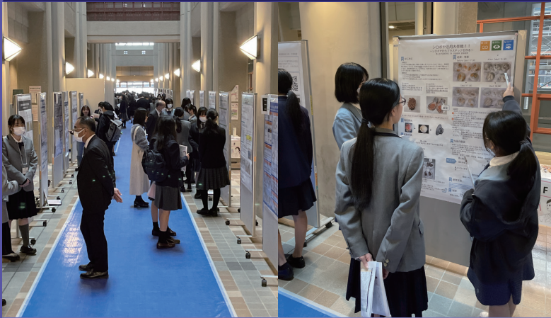
過去の発表会の様子